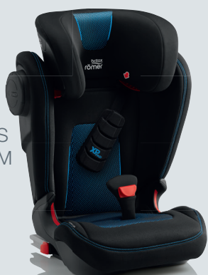
KIDFIX III S KIDFIX III M